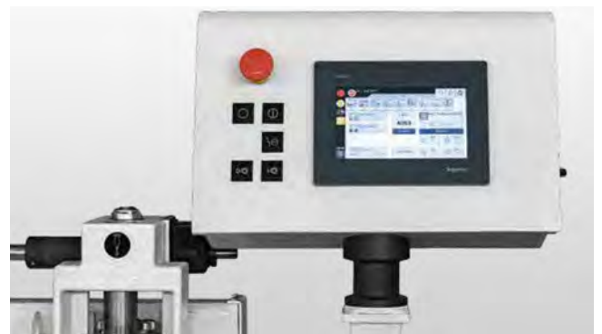
控制器 — 操作简便：触摸式显示屏界面确保了菜单栏快速集成反应，操作舒适