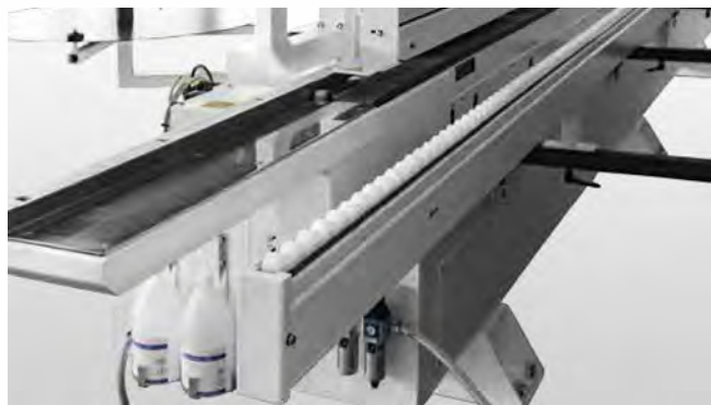
进料靠档：坚固的进料靠档有利于大尺寸重工件进料的安全操作